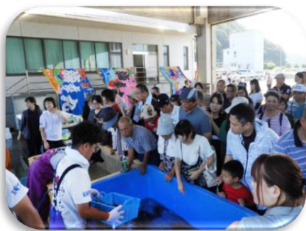
伊勢えび 特産品販売