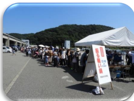
振る舞い 海鮮巻き・すり身鍋