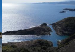
願いが叶うクルスの海