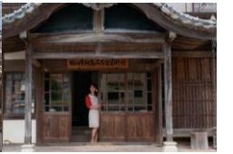
細島みなと資料館