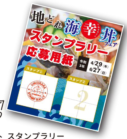
スタンプラリー台紙見本