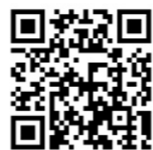
美郷町ホームページ

TEL : 0982-62-6203 FAX : 0982-66-3137 Mail : k-kawanishi@town.miyazaki-misato.lg.jp H P : http://www.town.miyazaki-misato.lg.jp/